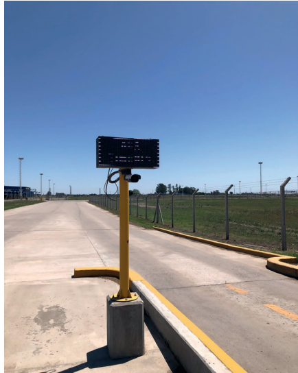
Display o Visor