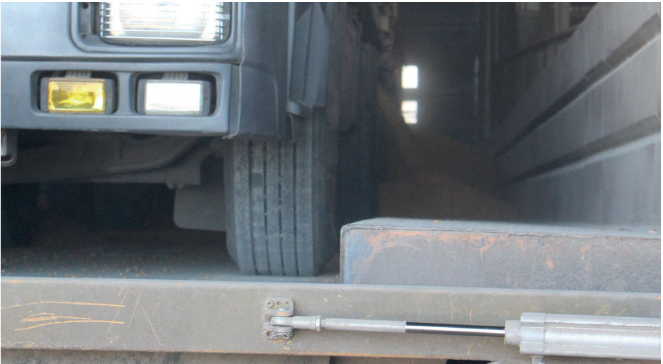
Camión en plataforma volcadora

El Funcionario del Complejo Portuario verificará la seguridad y/o sujeción de la unidad de transporte a la plataforma volcable antes de que se proceda a la descarga.