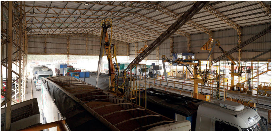
Proceso de calada