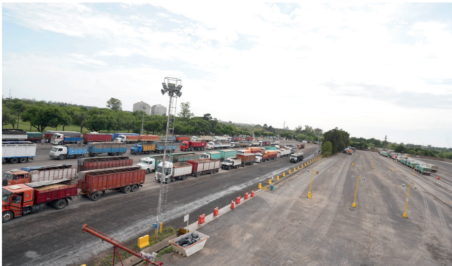
Playa de camiones